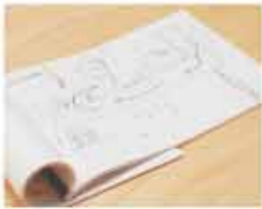
お客様にご購入のお宅にお渡しする「標準詳細図」

「標準詳細図」は本来工事関係者用のツールですが、ゼロではこれをお客様にお渡しし、住宅の基礎的な構造をはじめ、施工の細かい部分まで、お客様自身の目で確認していただけるようにしています。また、各現場には施工・管理担当者をポスターで掲示。つくり手の顔を知っていただきたいという願いと、建築に対する強い責任と自信を表しています。