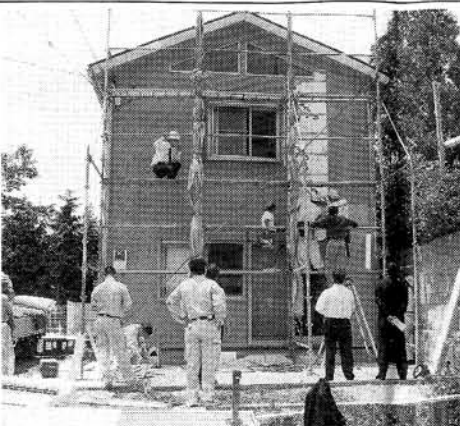
今年初めに雨漏りの連絡を受け、原因を徹底的に追及した物件。この姿勢が会社のレベルを底上げしている