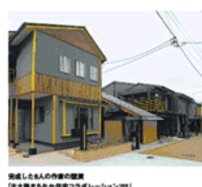
完成したお家の様子 「北大路まちなか住宅コレクション02」

【北大路まちなか住宅コレクション02】 完成したお家の様子「北大路まちなか住宅コレクション02」